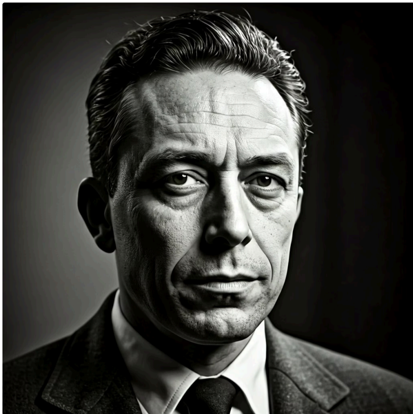
Albert Camus (1913-1960)

Avançando no tempo, chegamos a Albert Camus (1913-1960), uma figura central do século XX, cuja obra se tornou um farol para aqueles que buscavam compreender a condição humana após as grandes guerras e as crises existenciais. Camus, embora frequentemente associado ao existencialismo, preferia ser visto como um pensador do absurdo, explorando a tensão entre a busca humana por sentido e o silêncio indiferente do universo.