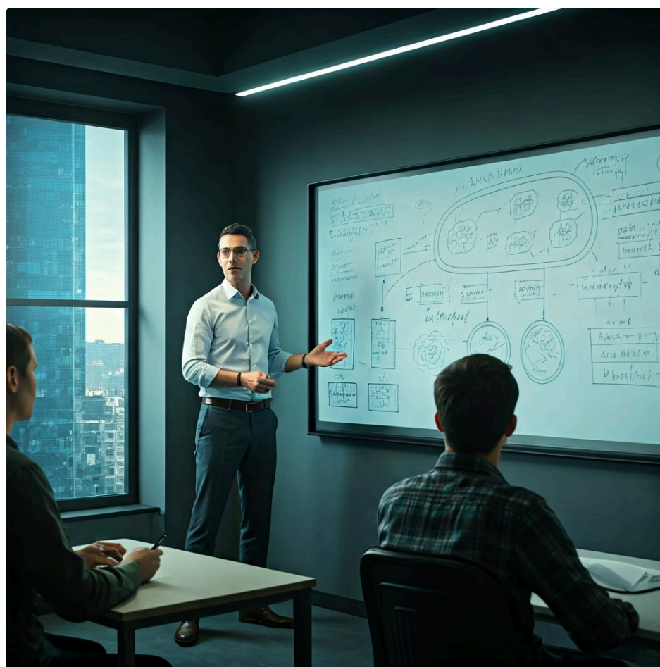
Exposição: como um professor explicando uma matéria

Ambos são cruciais para a troca de informações e ideias, mas operam com estratégias e intenções comunicativas diferentes, o que impacta diretamente a forma como o texto é construído e recebido.