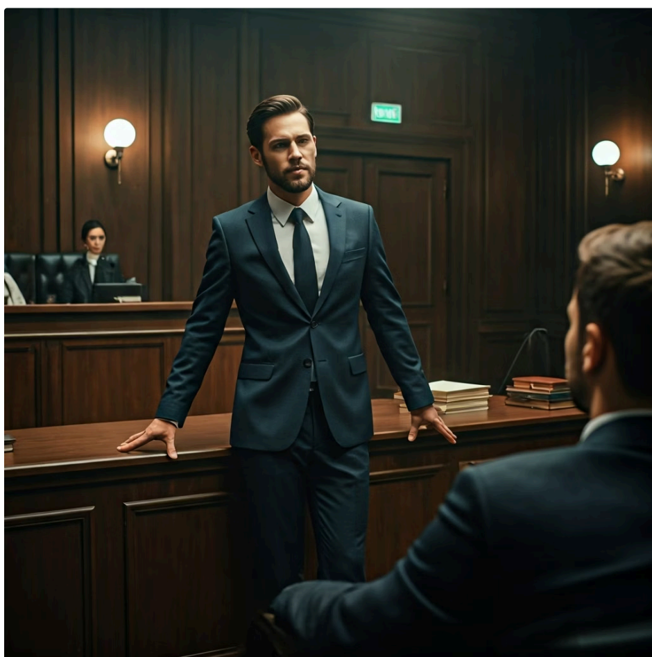
Argumentação: como um advogado defendendo seu cliente

Exemplo: Um texto que explica o ciclo da água, detalhando suas etapas sem emitir juízo de valor, é expositivo.