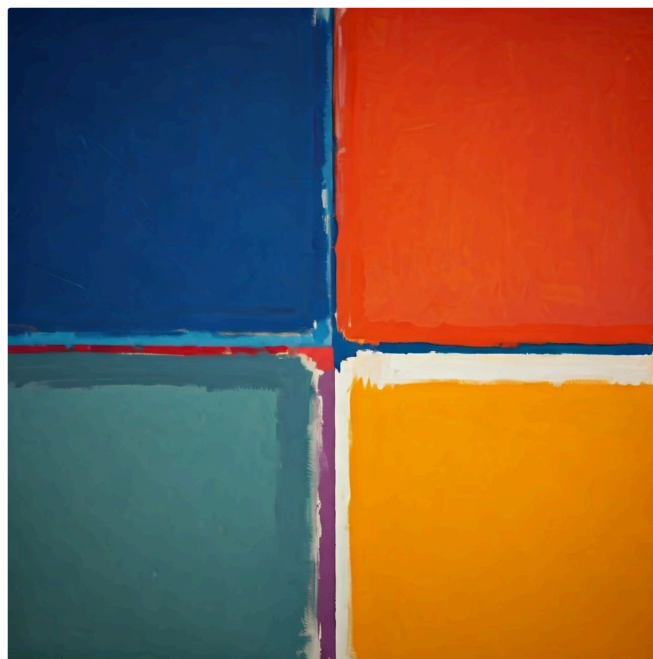
Obra de Mark Rothko exemplificando o Color Field Painting , com grandes blocos de cor que convidam à contemplação e evocam emoções profundas.