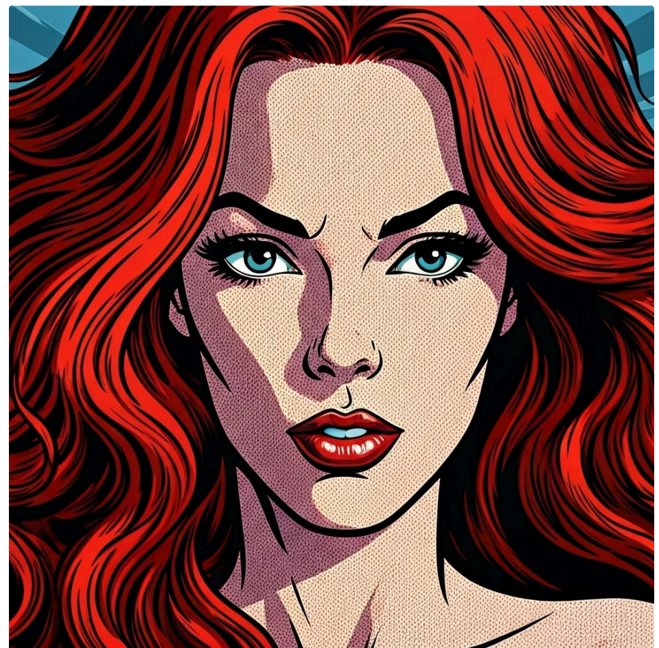
Obra de Roy Lichtenstein exemplificando o uso dos pontos Ben-Day e da estética dos quadrinhos na arte.